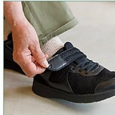
足の状態に合わせてベルトで微調節可能