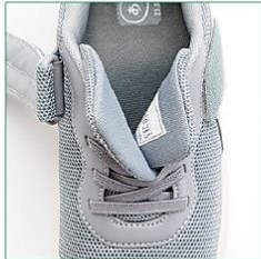
2枚形状のベロで巻き込みにくい!