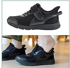
すべり台状の踵で履きやすい!